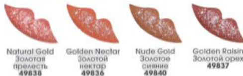
Natural Gold Золотая прелесть 49838