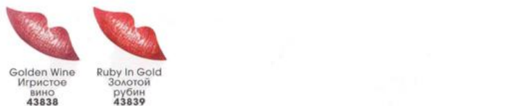
Golden Wine Игристое вино 43838