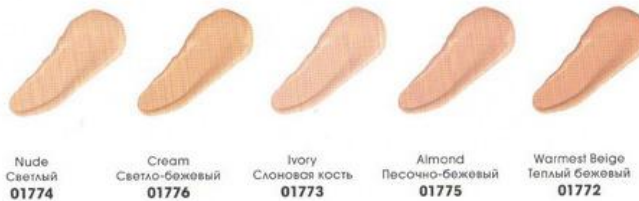
Nude Светлый 01774