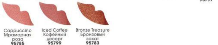
Cappuccino Мрачная роза 95785