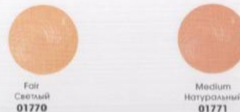
Fair Светлый 01770