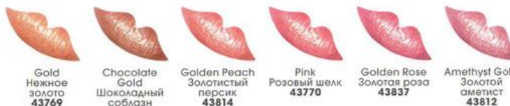
Gold Нежное золото 43769