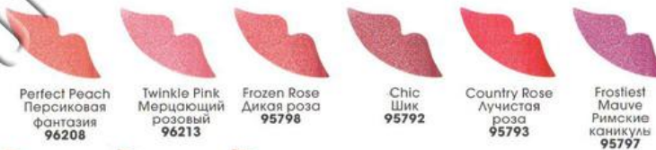
Perfect Peach Персиковая фантазия 96208