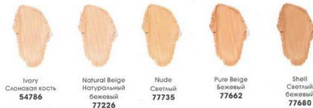
Ivory Слоновая кость 54786