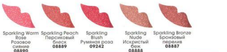
Sparkling Warm Rose Розовое сияние 08890