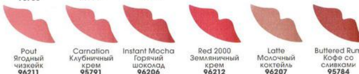
Рout Ягодный чизкейк 96211