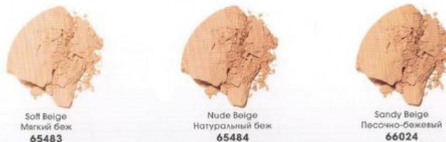
Soft Beige Мягкий беж 65483