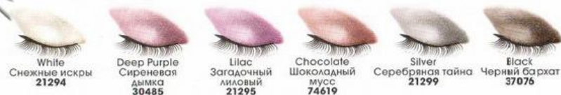
White Снежные искры 21294