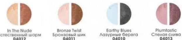
In The Nude Естественный шарм 04012