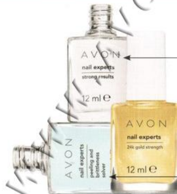
Средство для укрепления и роста ногтей „Хорошие результаты“ Strong Results 32017

Состав набора: лак для ногтей белого оттенка (12 мл); лак для ногтей натурального оттенка (12 мл); 30 защитных полосок.