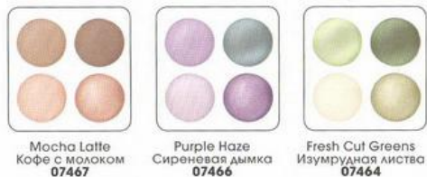
Mocha Latte Кофе с молоком 07467