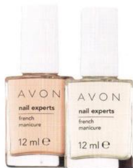
Набор для французского маникюра French Manicure Set 32021