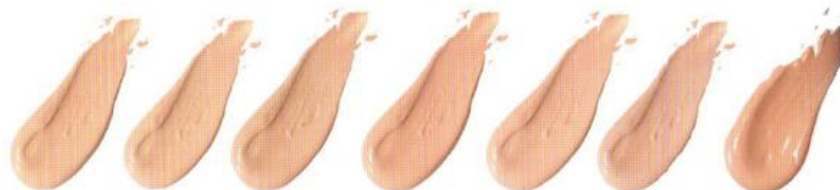
Light Beige Светлый бисквит 09866 Nude Светлый 09442 Natural Beige Натуральный беж 09863 Creamy Natural Светло-бежевый 09864 Shell Нежный беж 09862 Ivory Слоновая кость 09867 Medium Beige Теплый бежевый 09865