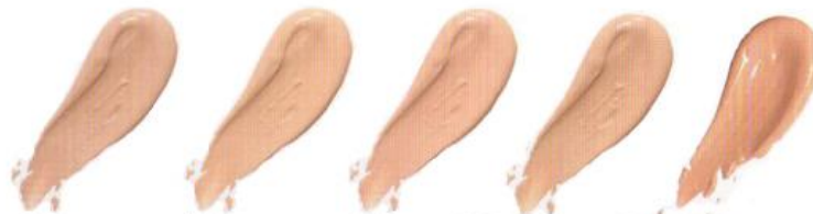
Ivory Слоновая кость 49715 Nude Светлый 49702 Shell Нежный беж 49703 Natural Beige Натуральный беж 49717 Medium Beige Теплый бежевый 49716