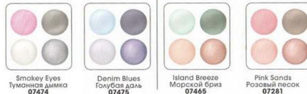
Smokey Eyes Туманная дымка 07474