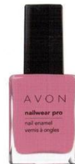
Лак для ногтей „Эксперт цвета“ Nailwear Pro Nail Enamel