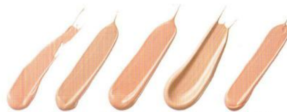
Ivory Слоновая кость 68791 Nude Светлый 68790 Almond Песочно-бежевый 68786 Cream Светло-бежевый 68789 Warmest Beige Теплый бежевый 68787